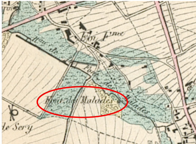
Carte de Vandermaelen (1845 ca)

C'était en fait un site comprenant une construction en pierre calcaire au niveau du sol et une résurgence adjacente qui l'alimentait en eau pure et fraîche. Un écoulement en aval du bac permettait à l'eau de se déverser dans le ruisseau tout proche.